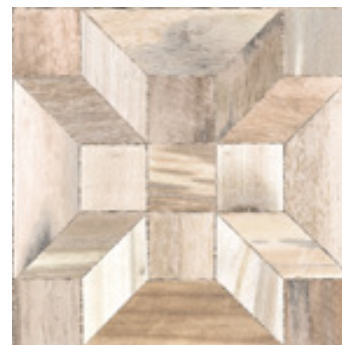
EFGH 04/19 S/G B3 Vertigo Beige claire 455 x 455 mm