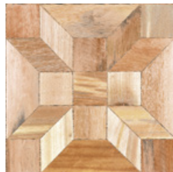
EFGH 01/19 S/G B3 Vertigo Beige foncé 455 x 455 mm

COULEURS / COLORS 455 x 455 mm / 400 x 400 mm