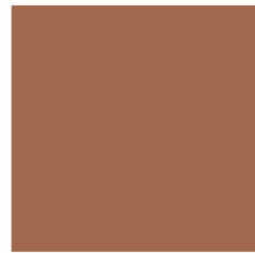
EFGH 02/21 S/G B8 Terre cuite 300 x300 mm